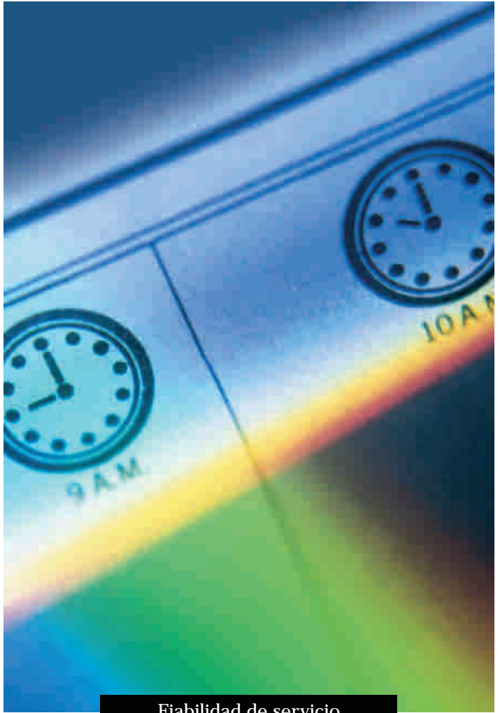
Fiabilidad de servicio